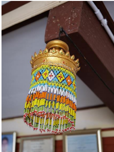
ภาพที่ 1 โคมไฟลูกปัดโนราปิดทองฝังเพชร

- หากทางมหาวิทยาลัยมีข้อเสนอแนะหรือส่งเสริมสนับสนุนก็ยินดีที่จะให้ความร่วมมือ และความต้องการที่อยากจะได้รับจากหน่วยงานของรัฐ คือ การทำโครงการเกี่ยวกับแหล่งเรียนรู้เกี่ยวกับโนราแบบครบวงจร ไม่อยากให้ศิลปวัฒนธรรมเหล่านี้สูญหายไป