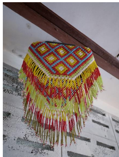
ภาพที่ 2 ลูกปัดประดับแผงโซล่าเซลล์