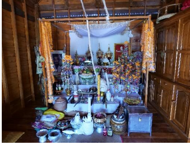
ภาพที่ 3 โต๊ะบูชาครุหมอโนรา